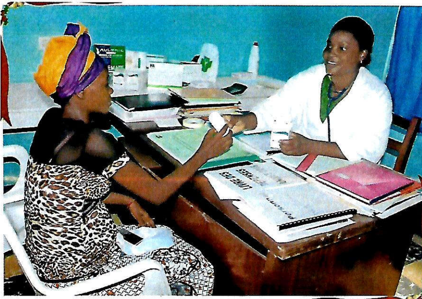
Prise en charge et soutien aux PVVIH/OEV