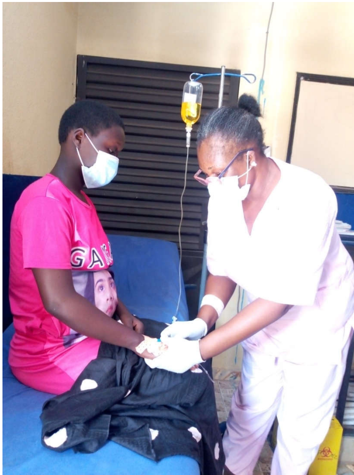
Prise en charge médicale d'un PVVIH/OEV