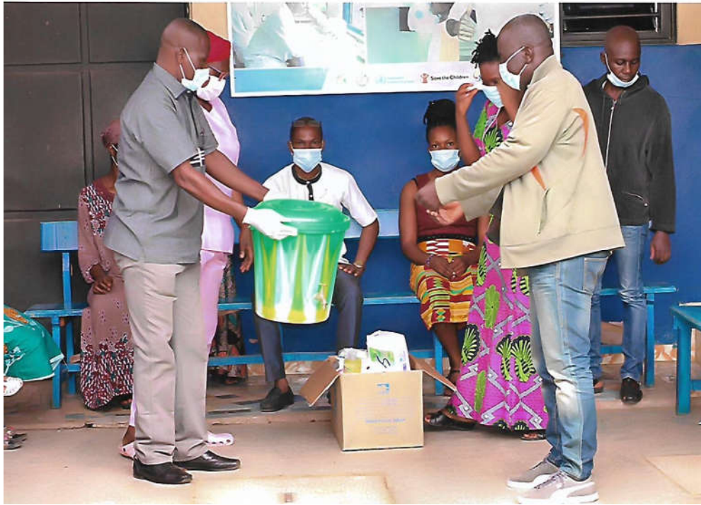
Remise de cache-nez, eau de javel aux différentes communautés des quartiers : Koko, Dar-Es-Salam et Gbintou (Bouaké).